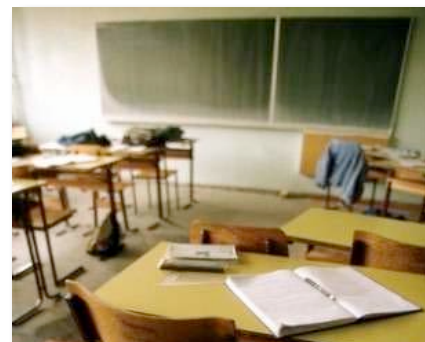
EVOLUTION DES EFFECTIFS SCOLAIRES ENTRE 2005 ET 2010

L'étude de l'évolution des effectifs scolaires des 5 dernières années montre globalement une stagnation du nombre d'élèves (en moyenne : 22 enfants/classe en maternelle et 24 enfants / classe en primaire). Toutefois, la répartition par quartier est bien différente, alors que la première circonscription d'Aulnay voit son nombre d'élèves diminuer depuis plusieurs années, la deuxième circonscription accueille, quant à elle, 300 élèves supplémentaires depuis 3 ans.