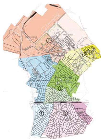
PERIMETRE DES CONSEILS DE QUARTIER